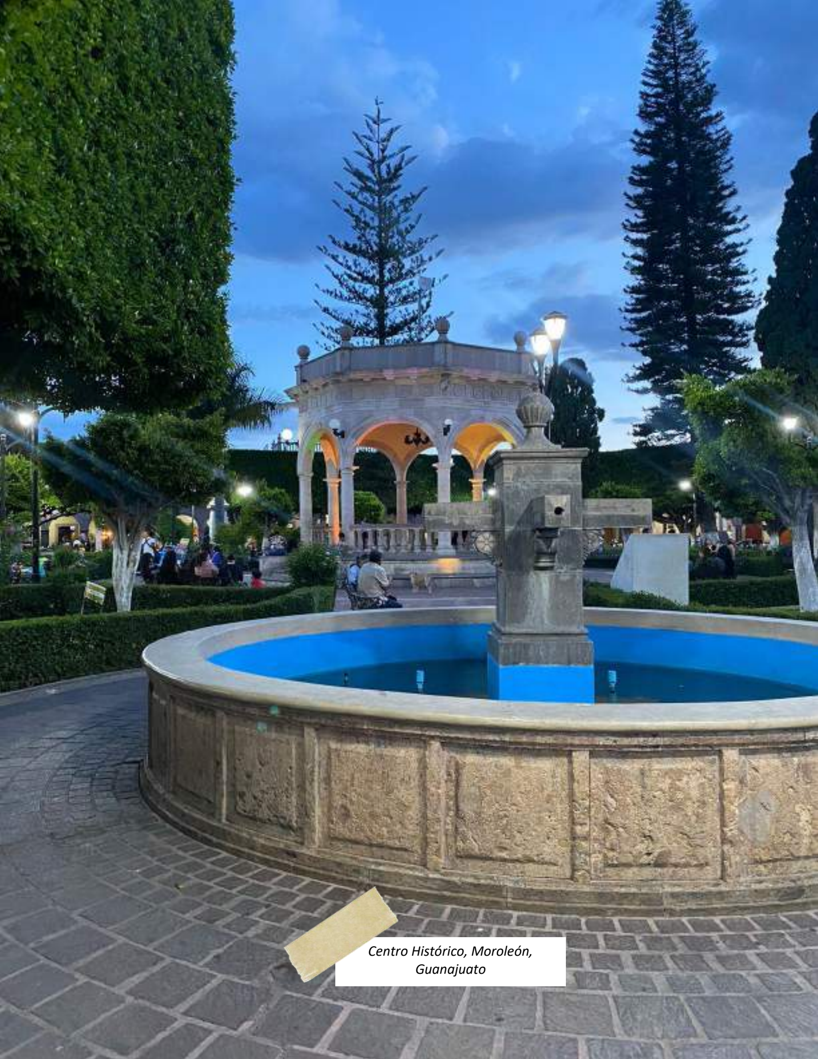
Centro Histórico, Moroleón, Guanajuato