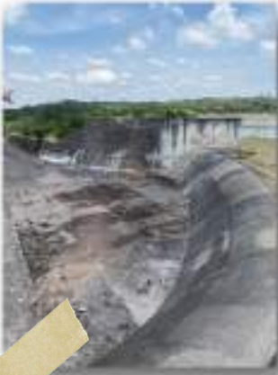
Presa de Quiahuyo, Moroleón, Guanajuato

Actualmente, en el municipio de Moroleón , Guanajuato, se cuenta con un registro de 29 sitios turísticos, entre los cuales se puede mencionar: Templo del Señor de la Clemencia , Templo de San Francisco , Parque Ecoturístico Los Amoles , Las Peñas , Las Tinajas , Cueva del Diablo , Cueva de la Mina , entre otros.