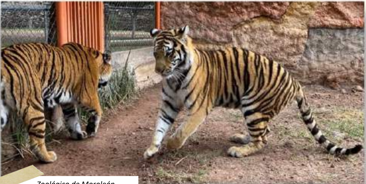
Zoológico de Moroleón, Moroleón, Guanajuato