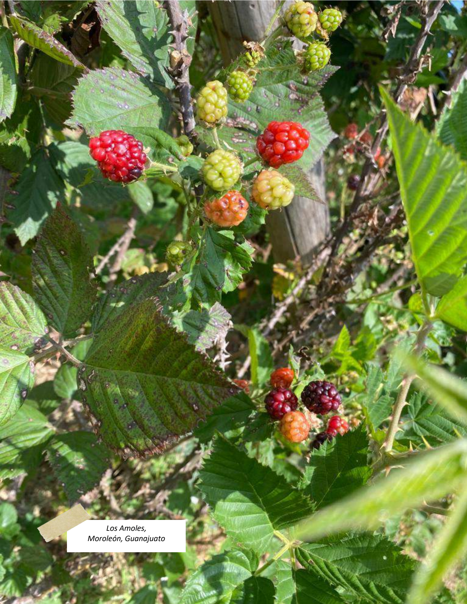
Los Amoles, Moroleón, Guanajuato