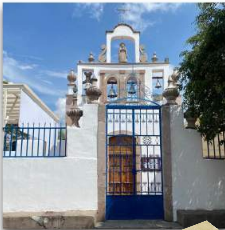
La Soledad, Moroleón, Guanajuato

Las potencialidades turísticas que se muestran a continuación mantienen un valor estimado a partir de la investigación y benchmarking de proyectos de similitud objetivo y estructura, en este sentido, los proyectos pueden variar en su valor comercial de acuerdo con las características del entorno y de las variables económicas del momento en el que se encuentren desarrollándose.