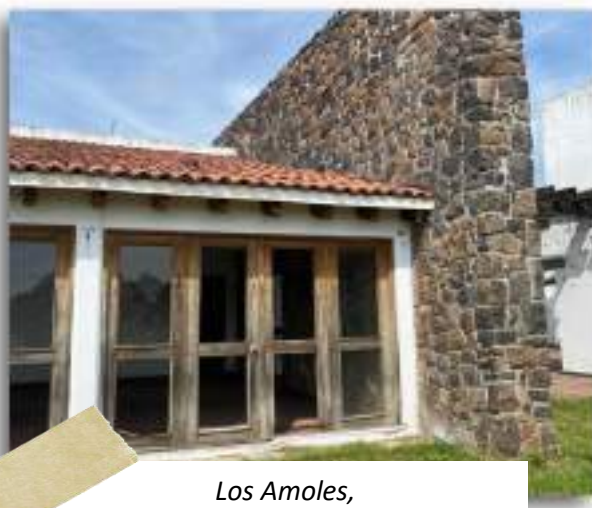
Los Amoles, Moroleón, Guanajuato

Ampliar y fortalecer las capacidades de atención y respuesta en el sector turístico a través de la articulación y coordinación con las dependencias e instituciones públicas y privadas del sector, que coadyuven a la implementación de soluciones enfocadas a la promoción, la competitividad y el desarrollo de la oferta turística de las regiones del Estado.