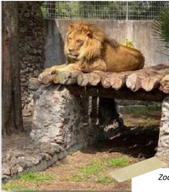
Zoológico, Moroleón Guanajuato.