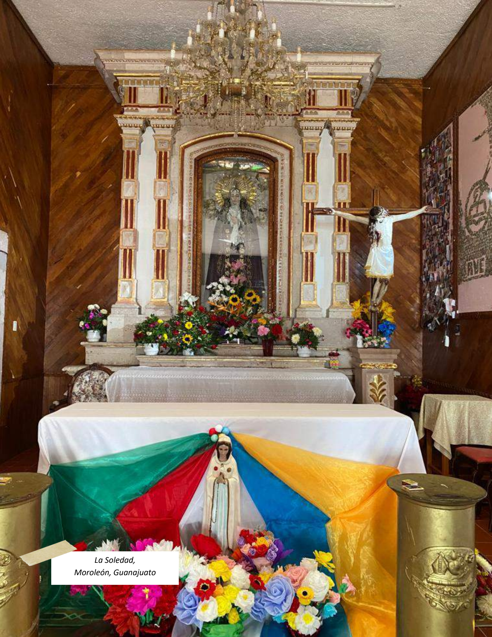
La Soledad, Moroleón, Guanajuato