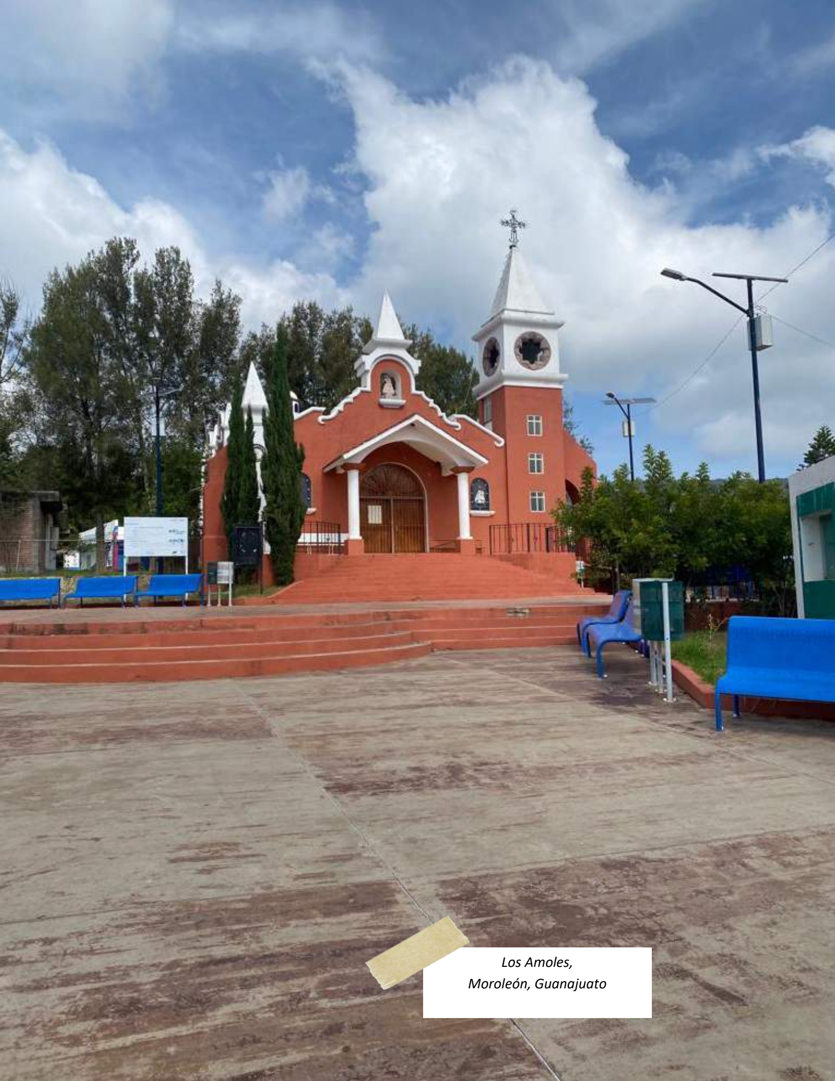
Los Amoles, Moroleón, Guanajuato