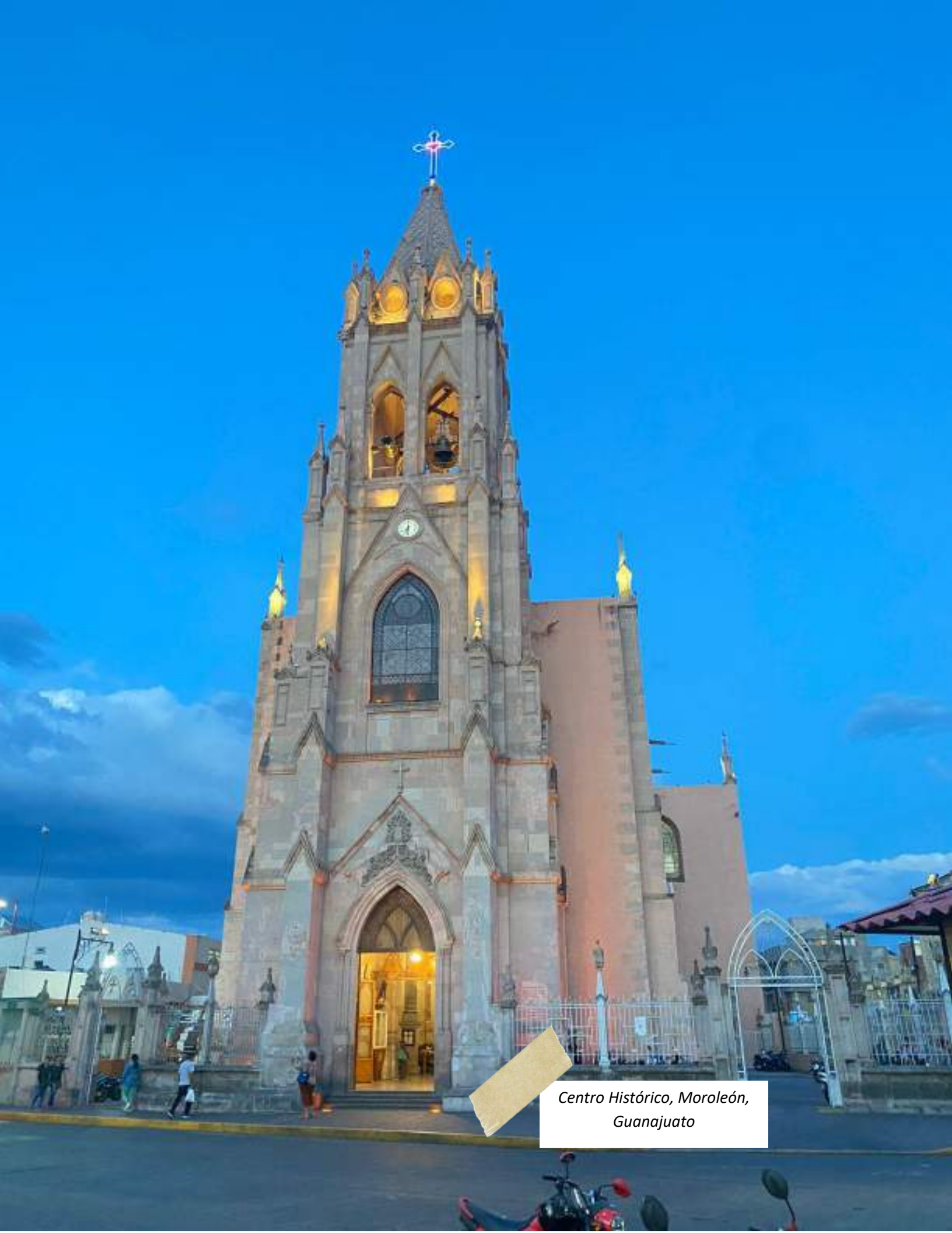
Centro Histórico, Moroleón, Guanajuato