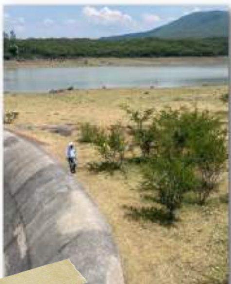
Presa de Quiahuyo, Moroleón, Guanajuato

La Secretaría de Turismo del Estado de Guanajuato , en su función de ente promotor de la oferta y demanda turística del estado, realiza acciones con el objetivo de posicionar a Guanajuato como destino competitivo en los diferentes segmentos turísticos con los que cuenta, además de seguir siendo referencia nacional e internacional en eventos, pero todo ello basado en la incorporación de nuevas tecnologías y procesos innovadores.