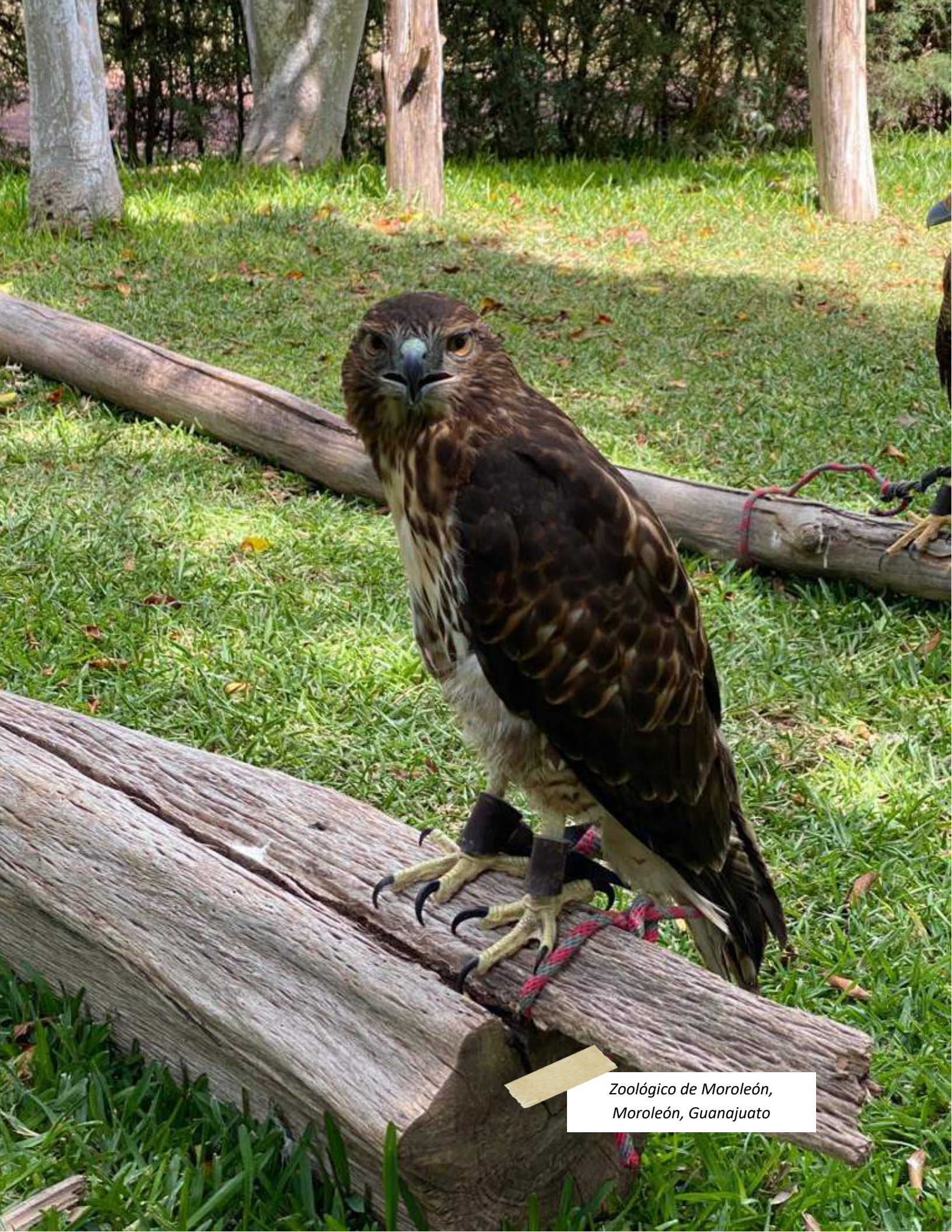
Zoológico de Morelón, Morelón, Guanajuato