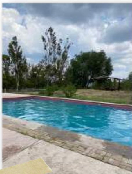
Zoológico de Moroleón, Moroleón, Guanajuato

La Secretaría de Turismo del Estado de Guanajuato , en su función de ente promotor de la oferta y demanda turística del estado, realiza acciones con el objetivo de posicionar a Guanajuato como destino competitivo en los diferentes segmentos turísticos con los que cuenta, además de seguir siendo referencia nacional e internacional en eventos, pero todo ello basado en la incorporación de nuevas tecnologías y procesos innovadores.