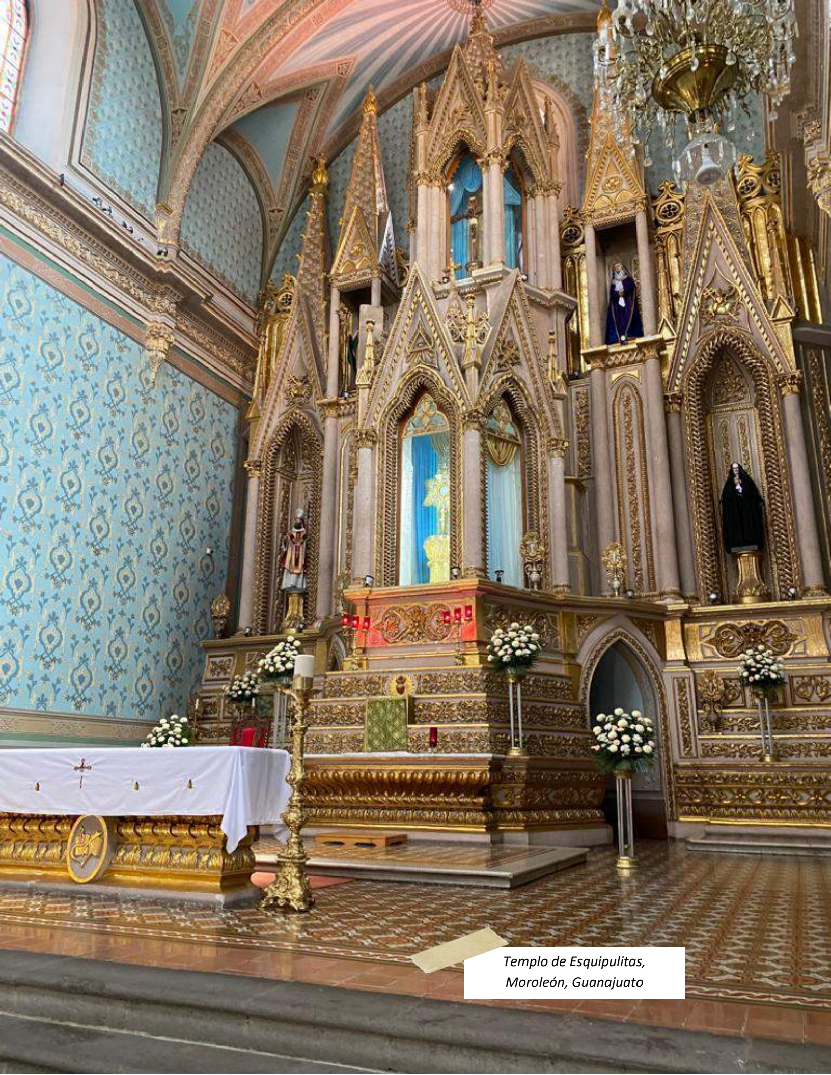
Templo de Esquipulitas, Moroleón, Guanajuato