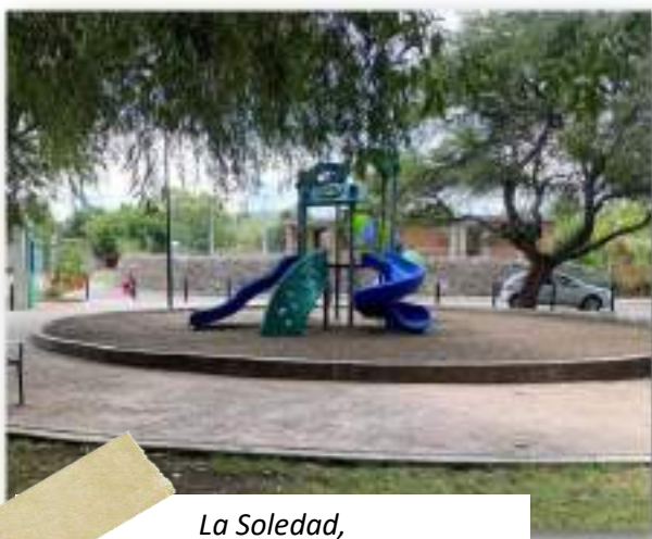
La Soledad, Moroleón, Guanajuato